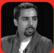
SOSO SAZESH Growth Pilots