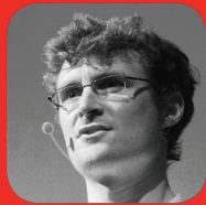
PADDY COSGRAVE Websummit