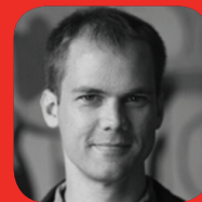
SIMON CAST ProdPad